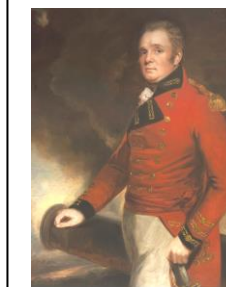
Πορτραίτο του Sir Thomas Maitland (John Hoppner ο ζωγράφος)

Ποιοι συντόνισαν τις εργασίες κατασκευής;