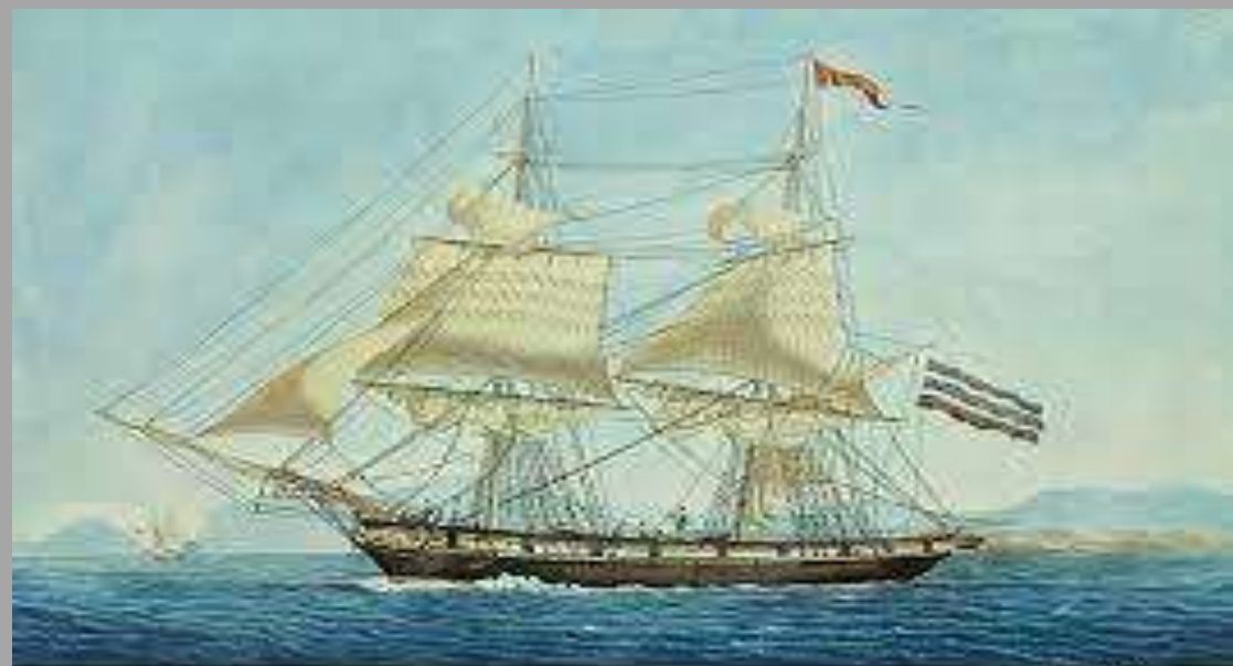
The ship on which the first voyage was made in 1492